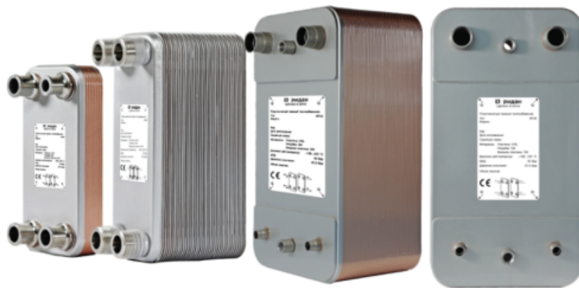
Рис.1 - Внешний вид теплообменников пластинчатых типа ВРНЕ

Теплообменники пластинчатые типа ВРНЕ предназначены для передачи тепловой энергии от одного теплоносителя к другому. Теплообменники пластинчатые типа ВРНЕ могут применяться в холодильных установках (компрессорных, абсорбционных), а также в тепловых насосах. В качестве рабочих сред могут использоваться с ГХФУ, ХФУ, ГФУ, ГФО и природные хладагенты не вступающие в реакцию с медью, технические и холодильные масла, вода для технических нужд и систем ГВС, спиртосодержащие растворы, водные растворы гликолей.